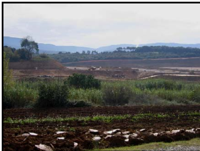
Paisatge que inclouria el PAV estan en perill per la construcció de nova indústria i el TAV

productes amb menys impacte ambiental, com és la denominada producció ecològica; dedicar el temps per a escollir productes propers al lloc de consum (evitant l'enorme impacte de la mobilitat i el consegüent increment de la contaminació); consumir productes de comerç local vinculats a la producció local; etc.